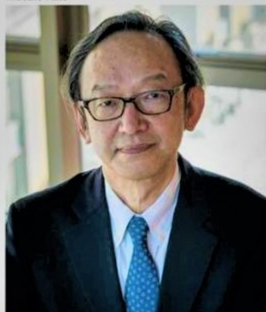
おかざき・てつじ / 東京大学大学院経済学研究科教授。1981年東京大学卒業、86年東京大学大学院経済学研究科博士課程修了(経済学博士)。99年より現職。